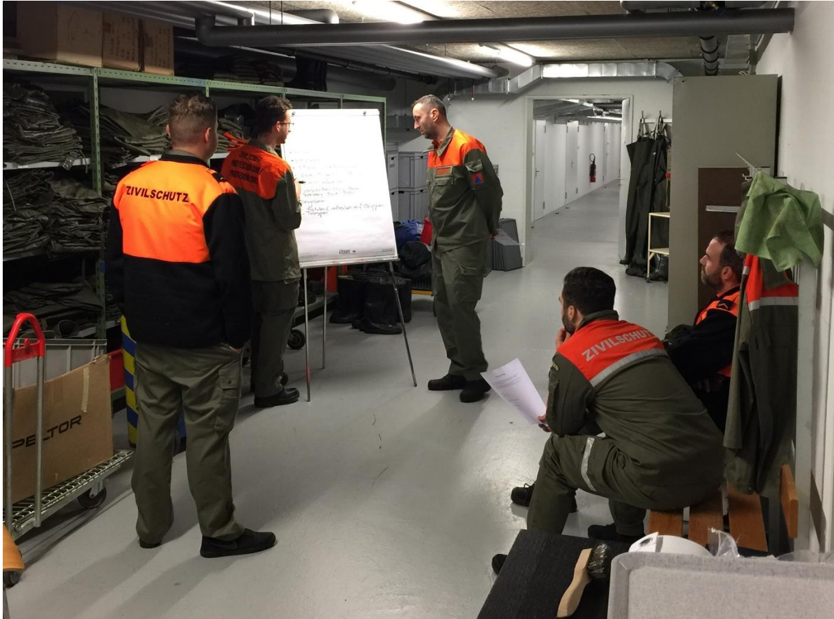
Abbildung 3: Gruppenarbeit «Evakuierung einer Schulklasse»