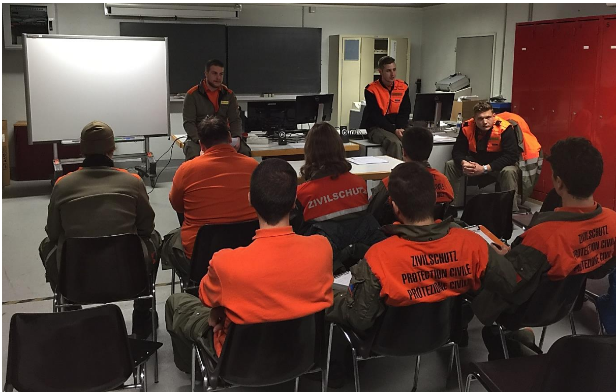
Abbildung 2: Filmsequenzen und Workshop zum Thema Asyl und Migration