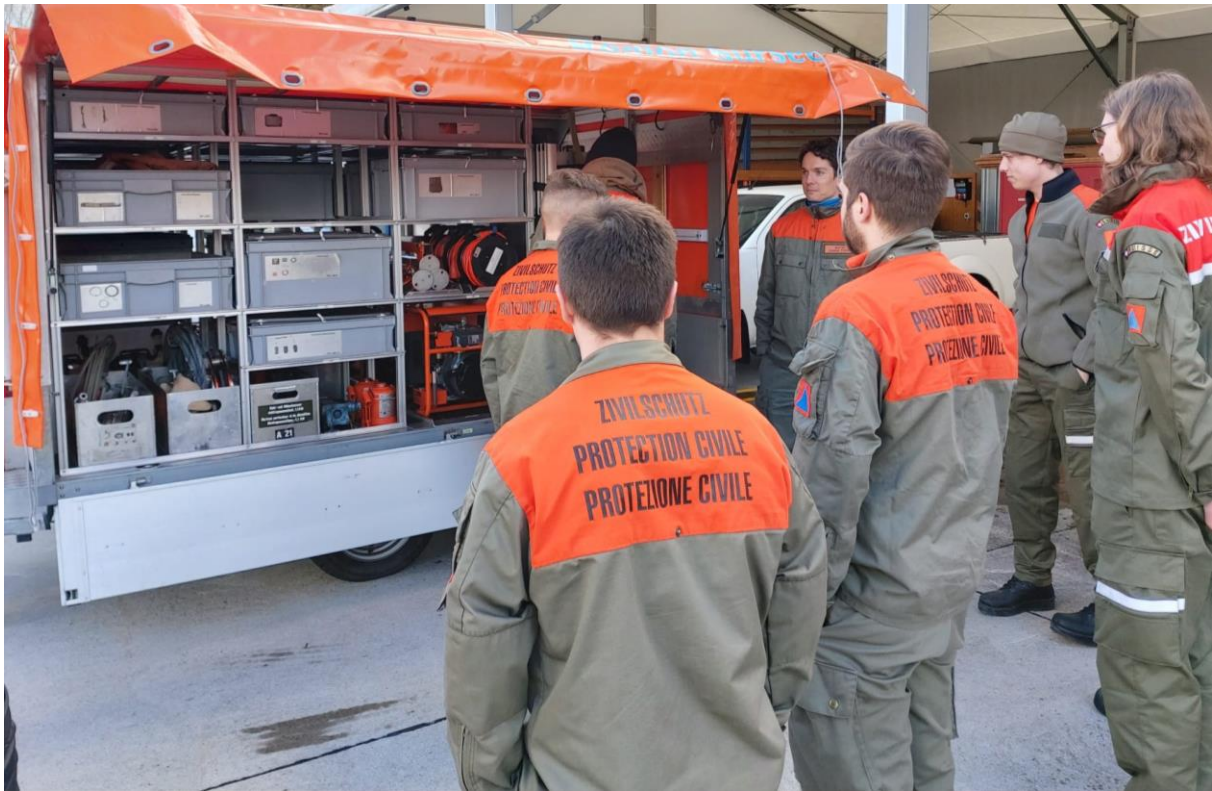
Abbildung 1: Materialkenntnisse auffrischen