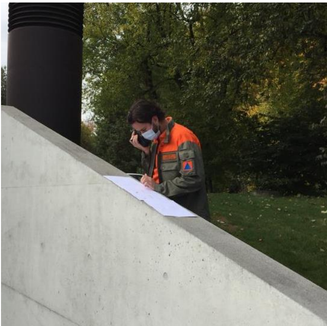
Abbildung 1: Polycm-Übung