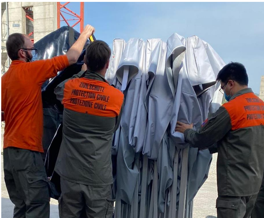
Abbildung 3: Aufbau eines Zelts